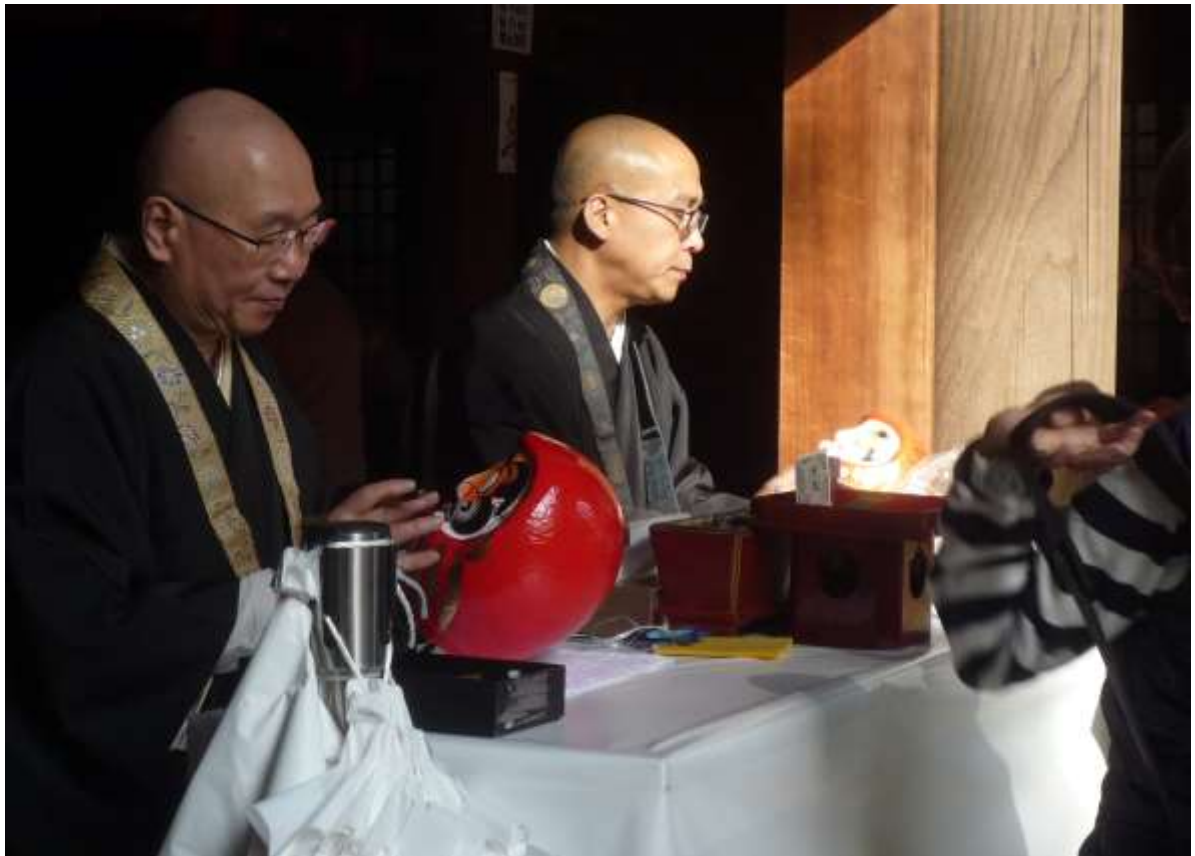
早や七年復興念じ眼を入れる (正二)